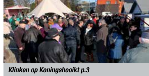
Klinken op Koningshooikt p.3