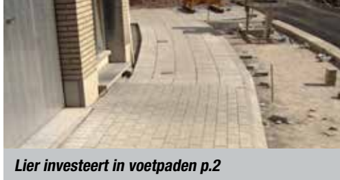
Lier investeert in voetpaden p.2