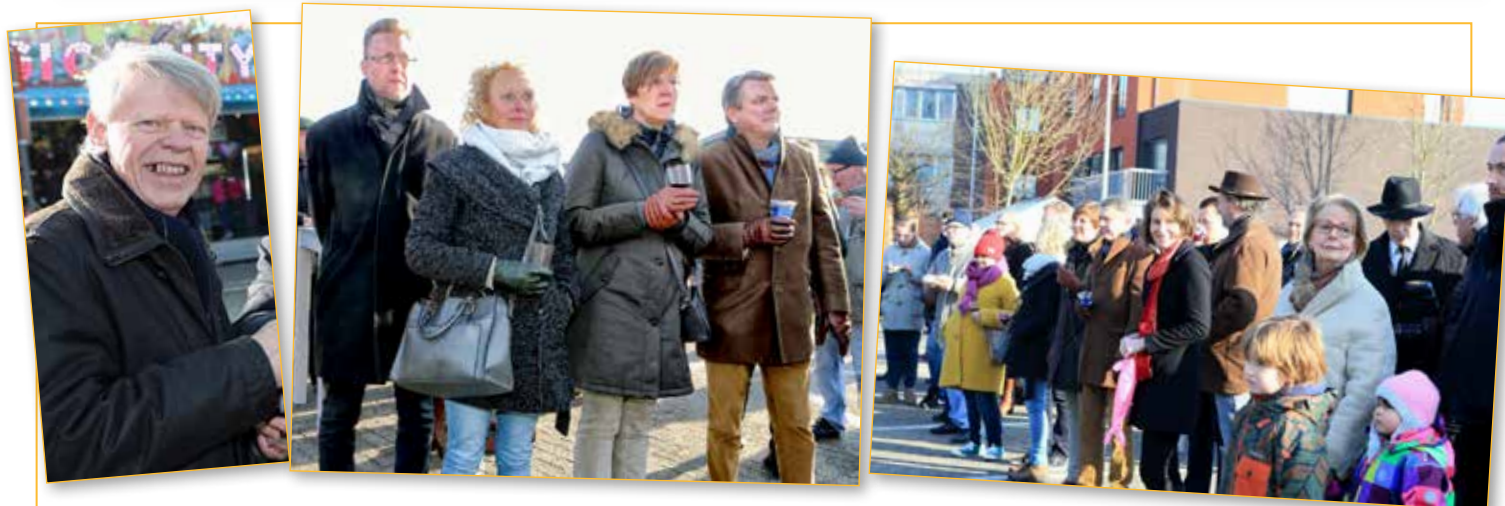
▲ Heel wat Hooiktenaren en Lierenaren zakten af naar de nieuwjaarsreceptie in eigen dorp.