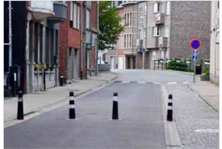
▲ Een nieuw mobiliteitsplan mag shoppers, toeristen en Lierenaars niet verjagen uit de stad.

Met de N-VA in het schepencollege investeerde het stadsbestuur de voorbije jaren stevig in de promotie van Lier als bereikbare stad. Maatregelen zoals het gratis Liers Half Uurtje, 400 extra parkeerplaatsen en nieuwe fietspaden waren een schot in de roos.