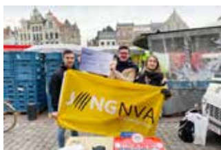
▲ In november verzamelden onze Jong N-VA'ers een mooie som voor Rode Neuzen-dag. Met oudjaar trakteerden ze de zangertjes in Hooikt.