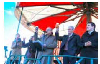
▲ Het stadsbestuur verwelkomde onze inwoners op de gesmaakte recepties in Lier en Hooikt.